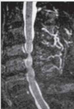
m, 72 J., zervikale Myelopathie bei Spinalstenose m, 72 yrs, cervical myelopathy and spinal stenosis

Notwendigkeit der multisegmentalen Spondylodese der oberen Wirbelsäule (C3-Th3). Instabilitäten unterschiedlicher Genese nach kompletter oder incompletter Korpektomie infolge Wirbelkörperdestruktionen, z.B. bei Tumor oder Fraktur.