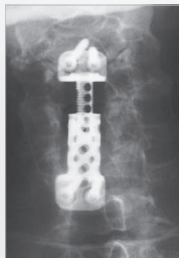
Instrumentation mit ADDplus Instrumentation with ADDplus